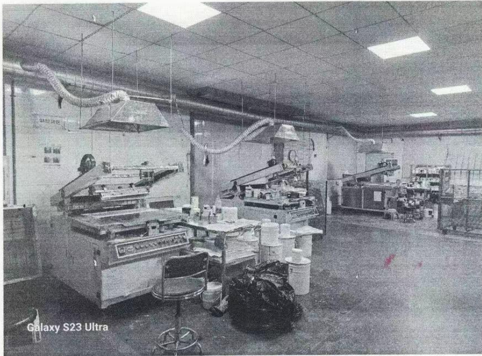
Galaxy S23 Ultra